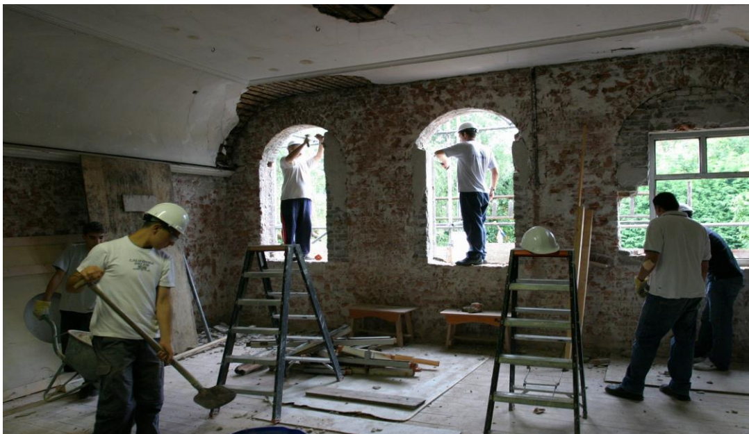
Joodse en Palestijnse jongeren kwamen uit Israël en hielpen in 2004 met het openbreken van de dichtgemetselde ramen. Toen kwam er na lange tijd weer licht in het oude gebouw.