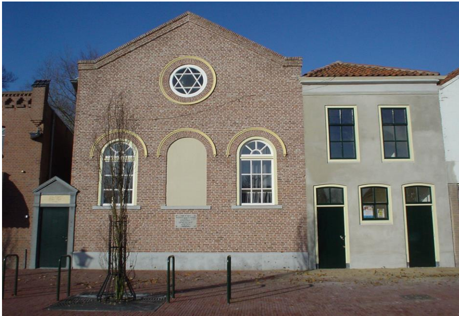
Het gerestaureerde synagogecomplex

Op 11 september 2005 is de gerestaureerde synagoge officieel in gebruik genomen als plaats van ontmoeting en cultuur. Dit kon worden gerealiseerd met steun van sponsors en donateurs.