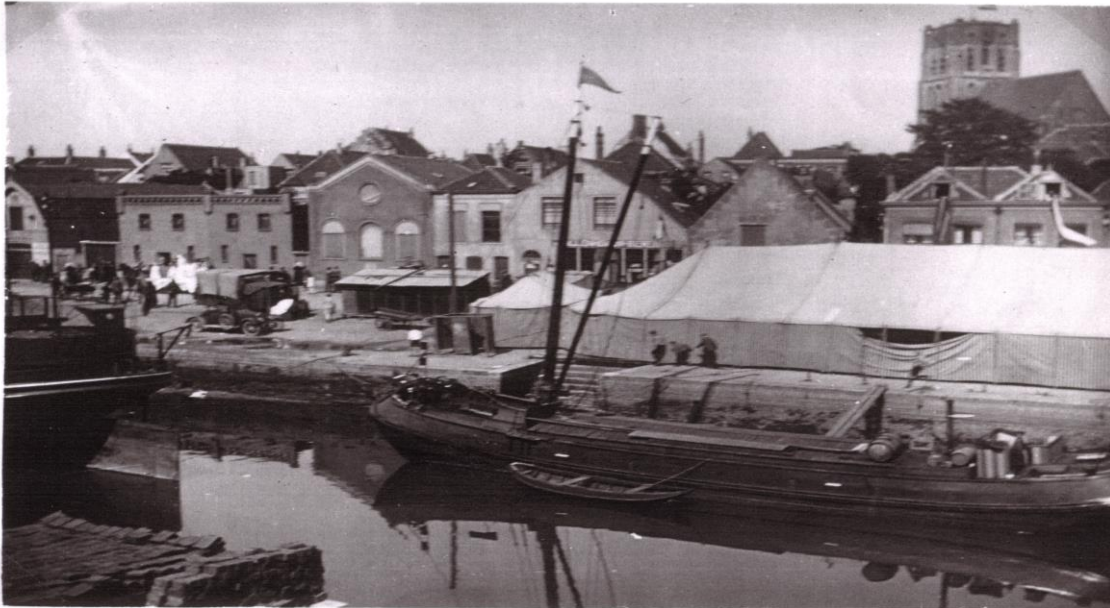
De Brielse synagoge omstreeks 1930?

voor het nieuwe bedehuis hadden gegeven, alsook aan den architect en de bouwlieden, door wier zorg een zo schoon gebouw was verzeen. Er waren verschillende burgerlijke en militaire autoriteiten uitgenodigd. Ook de predikant van de Hervormde Luthersche gemeente van Brielle was in het kerkgebouw aanwezig.